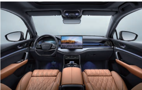
Taba (Nappa deri)