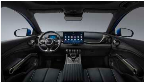
Siyah (Vegan deri)