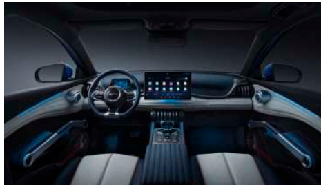
Lacivert & Beyaz (Vegan deri)