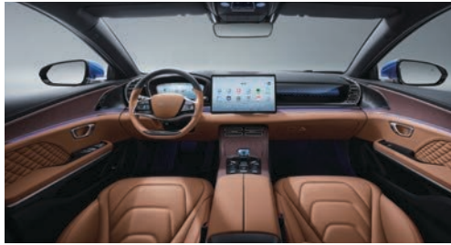
Taba (Nappa deri)