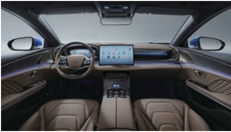
Kahverengi (Nappa deri)