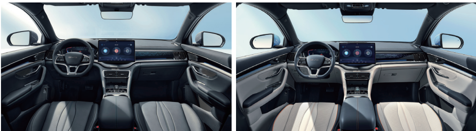
Siyah (Vegan deri)