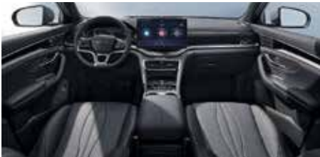
Siyah (Vegan deri)