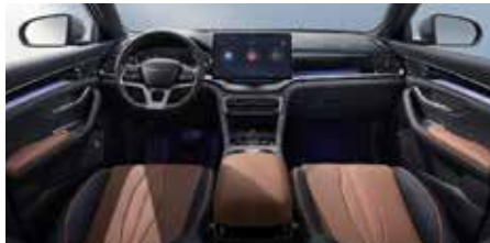
Siyah & Taba (Vegan deri)